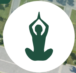
1. Área de yoga, hamacas y alberca