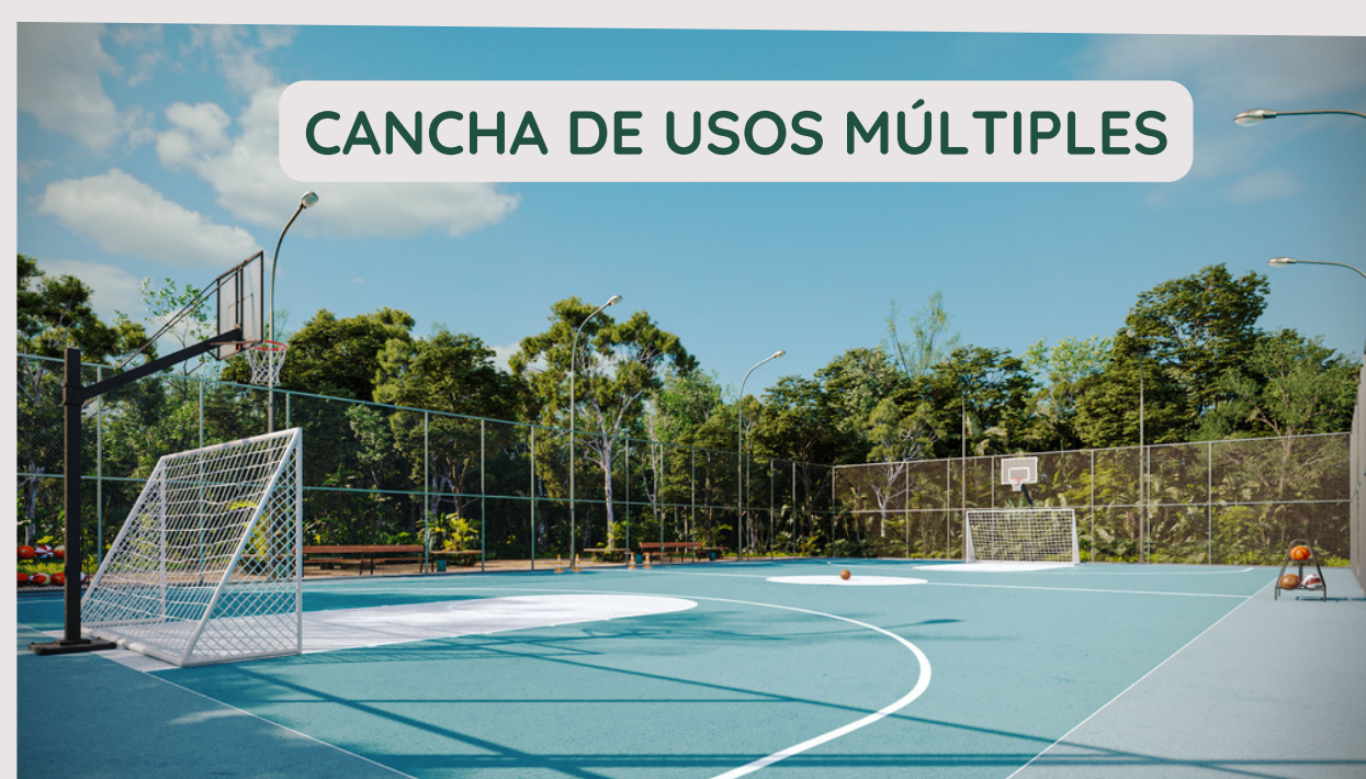
CANCHA DE USOS MÚLTIPLES