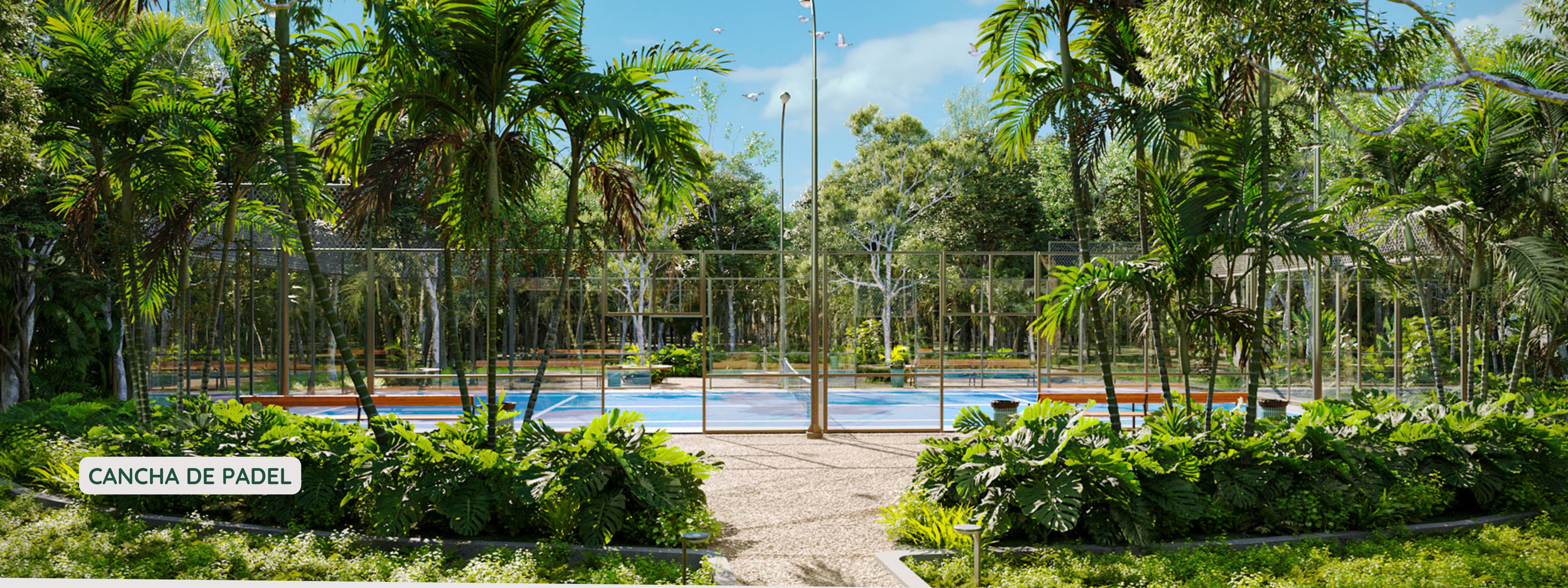
CANCHA DE PADEL