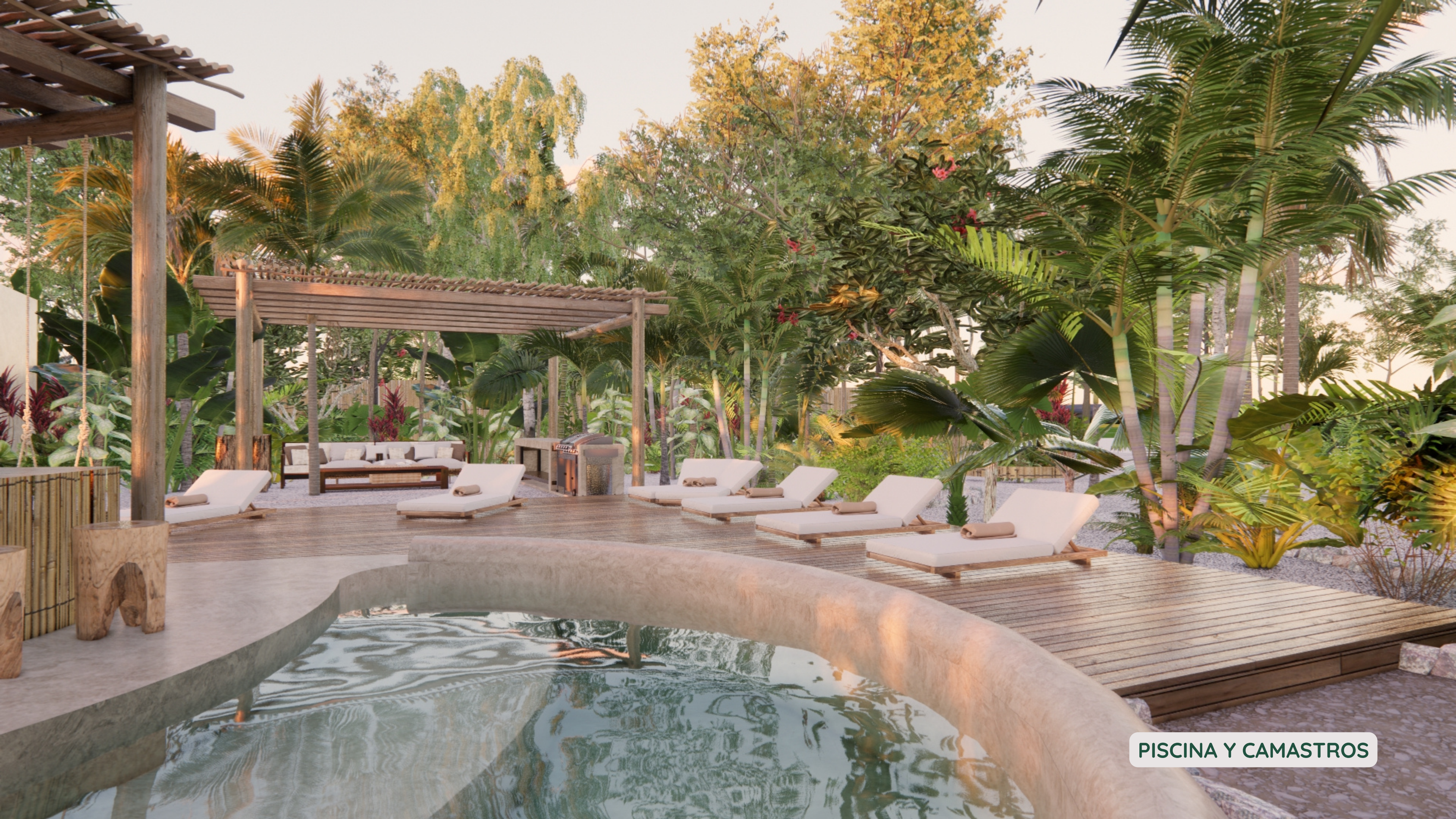
PISCINA Y CAMASTROS