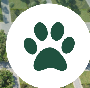
6. Kids Park