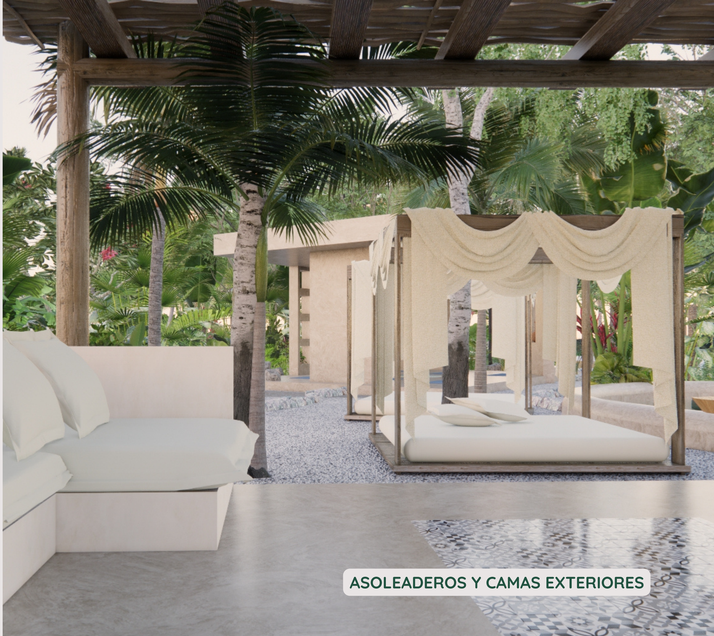
ASOLEADEROS Y CAMAS EXTERIORES